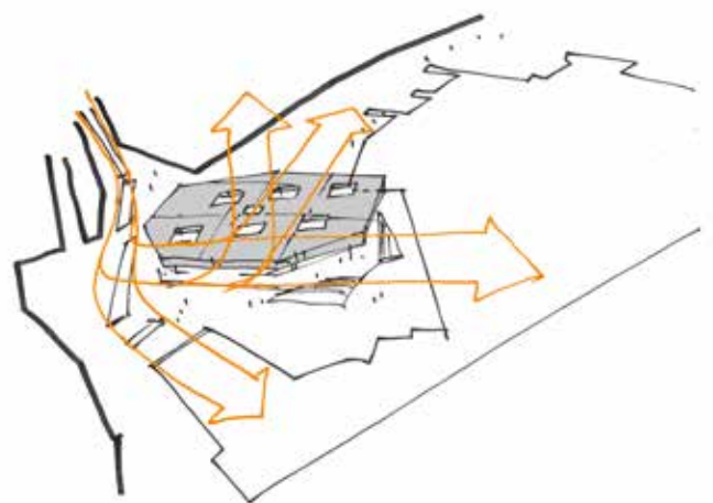
Diagrammet viser hvordan trafikken kan passere forbi og under bygningen. Bygningen er hævet så gående og cykelister kan passere på gadeniveau under bygningen og ned til havnen og vandet. Der er parkeringsanlæg under jorden og Letbanen får et stop under bygningen.