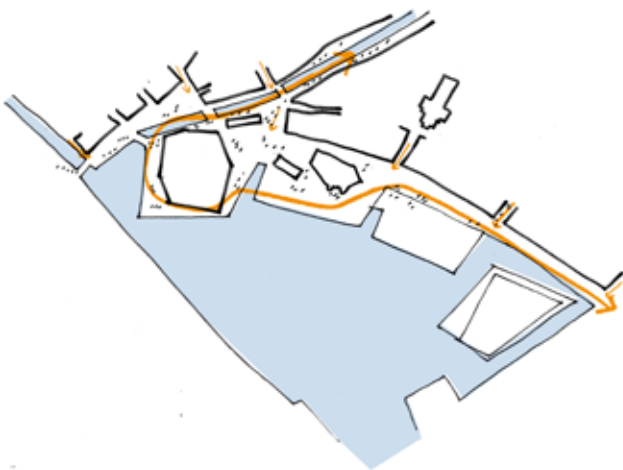
Diagrammet viser hvordan gående har adgang til havnen og vandet.