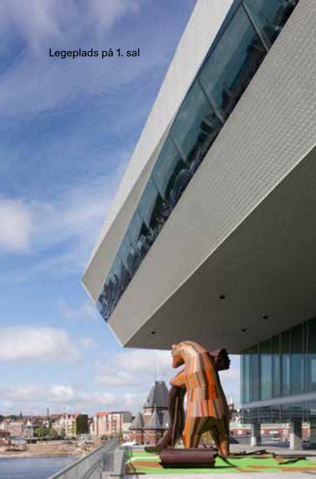
Legeplads på 1. sal