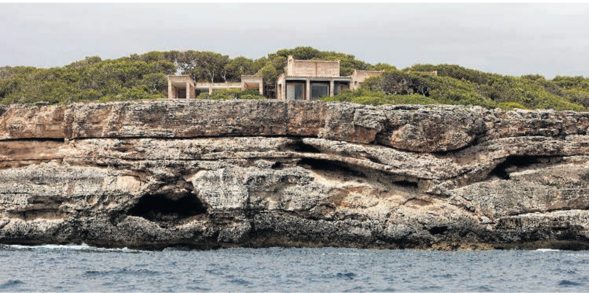
▲ Jørn Utzon tegnede i 1971 sit og familiens hus, Can Lis, på en stejl klippekant på Mallorcas sydøstlige kyst. Huset er bygget i gule sandsten fra den klippe, hvor det er opført, og er tænkt at skulle ligne noget, der er skudt direkte op fra jorden.