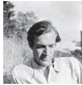
▲ Jørn Utzon fotograferet i 1945.

"Jeg ser ham ikke som en social samfundstænkner, for han har ikke beskæftiget sig meget med socialt boligbyggeri. Til gengæld var han meget optaget af øjeblikket og evnen til at være nysgerrig på livet. Det så man blandt andet i hans interesse for naturen og det organiske. Han så der en sammenhæng i tinge-